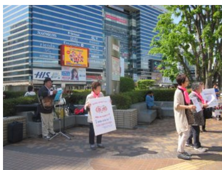
埼玉東民商高橋事務局長も応援!

平日の昼間とあって、立ち止まって署名の数は少なかったですが、シール投票は12人の方が参加してくれました。平和でこそ商売繁盛!は業者婦人の願いです。と道ゆく人たちにアピールもおこないました。