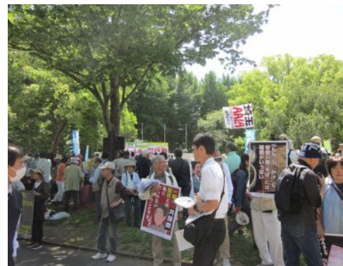
『もり』も『かけ』も安倍の『そば』には疑惑がいっぱい!と書いたプラカードが目をつけていました