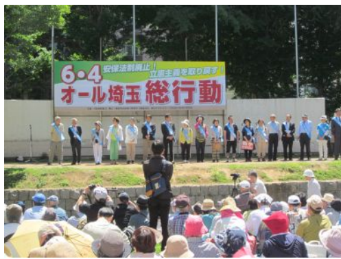
埼玉総行動発起人が揃ってあいさつ