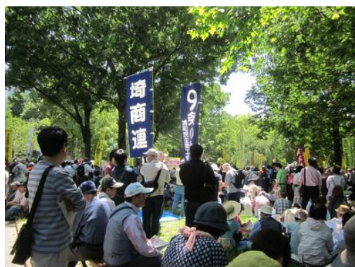
浦和民商9条の会の旗の下に集結