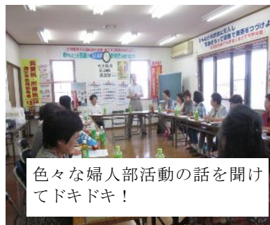
色々な婦人部活動の話を開けてドキドキ!

6月16日(木)午後1時より大宮民商会議室をお借りして上尾、桶川北本、岩槻、大宮、浦和民商総勢21名で、浦和婦人部から6名が参加しました。婦人部の手引きと私達を取り巻く情勢の学習後、休憩を挟み所得税法第56条についてディスカッション形式の学習会を行ない、参加者から活発な意見が数多く寄せられました。