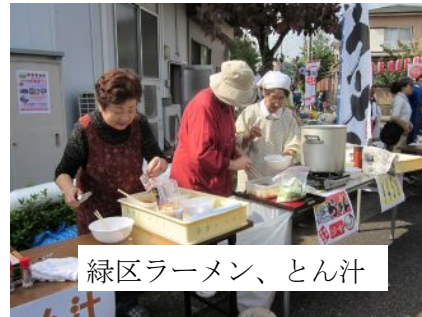
緑区ラーメン、とん汁