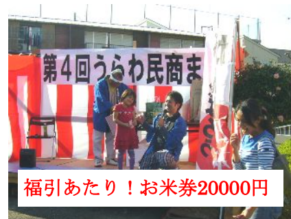
福引あたり！お米券20000円