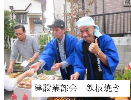
建設業部会 鉄板焼き