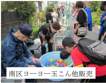
南区ヨーヨー玉こん他販売