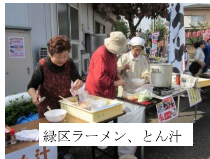
緑区ラーメン、とん汁