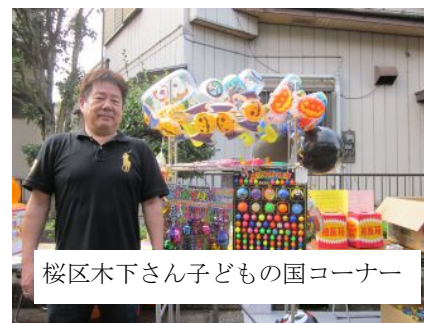
桜区木下さん子どもの国コーナー