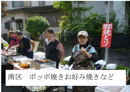
南区 ポップ焼きお好み焼きなど