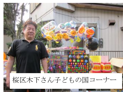
桜区木下さん子どもの国コーナー