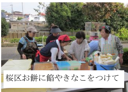
桜区お餅に餡やきなこをつけて