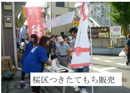
桜区つきたてもち販売