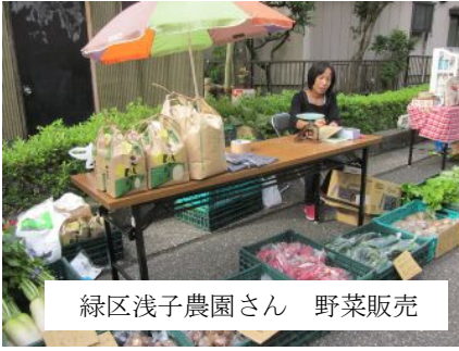
緑区浅子農園さん 野菜販売