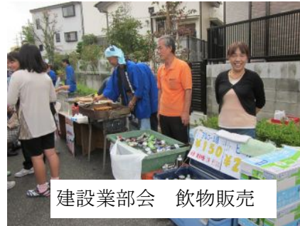
建設業部会 飲物販売