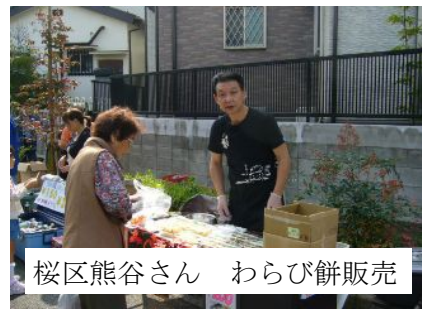
桜区熊谷さん わらび餅販売