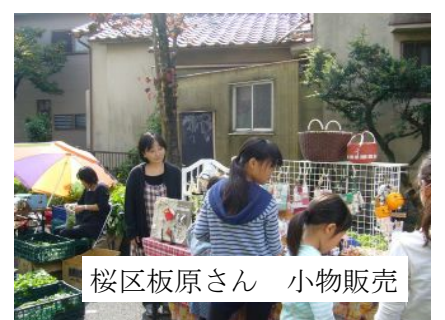
桜区板原さん 小物販売