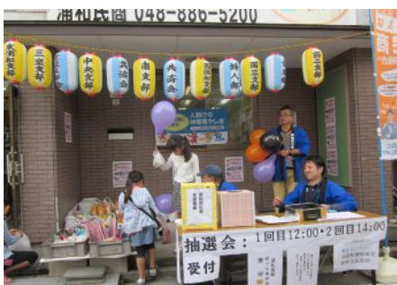
抽選会：1回目12:00・2回目14:00 受付