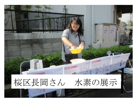
桜区长岡さん 水素の展示