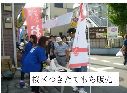
桜区つきたてもち販売