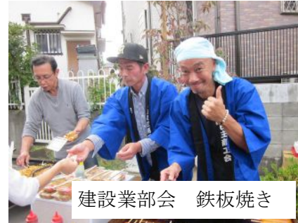
建設業部会 鉄板焼き