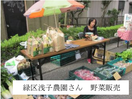
緑区浅子農園さん 野菜販売