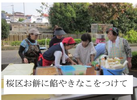
桜区お餅に餡やきなこをつけて