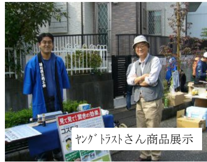
ヤクドラストさん商品展示