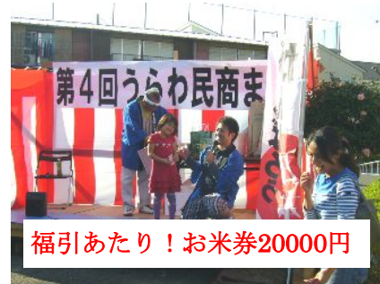
福引あたり！お米券20000円