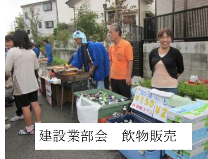
建設業部会 飲物販売