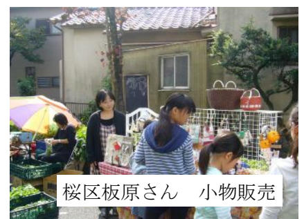
桜区板原さん 小物販売