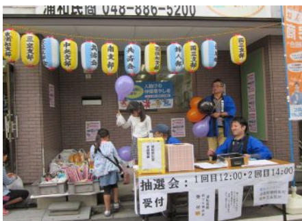
抽選会：1回目12:00・2回目14:00 受付