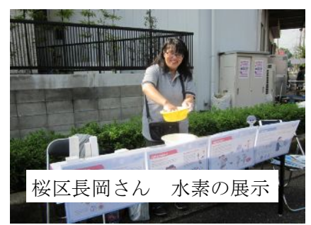
桜区长岡さん 水素の展示