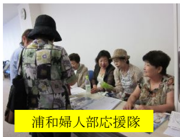
浦和婦人部応援隊

発行 浦和民主商工会 www.minsyoo.jp さいたま市浦和区 本太5-38-3 電話886-5200 FAX886-5454 メール：Urawa@ minsyoo.jp