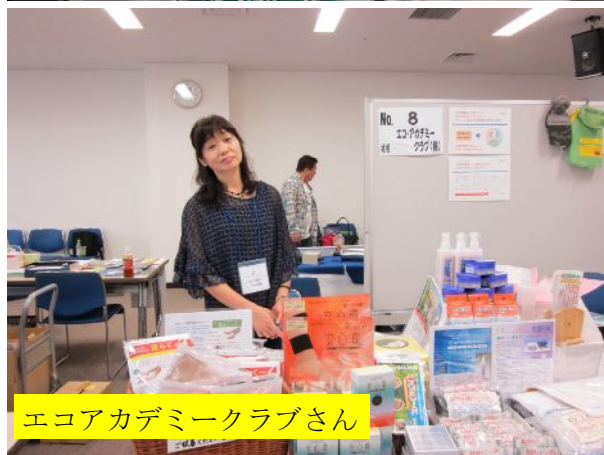
エコアカデミークラブさん